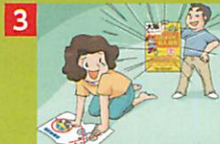
3 自転車事故に備えた賠償保険に入っていたので!