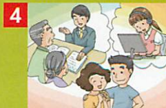
4 相手との賠償交渉も保険会社のスタッフに任せて安心、解決へ!