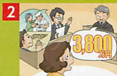
2 事故が原因で重度の後遺障害を被ったために、高額の賠償金が裁判で決定!