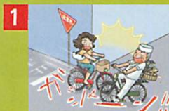
1 突然の自転車事故!

男子小学生が女性と衝突。女性が意識不明となり、事故を起こした小学生の母親に9,521万円の賠償を命令 (神戸地方裁判所 平成25年7月4日判決)