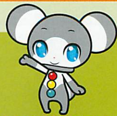
福岡県交通安全協会キャラクター しくまる

福岡県では、自転車条例が改正され、令和2年10月1日より県内で自転車を利用される人すべてに「自転車賠償保険」への加入が義務となりました。