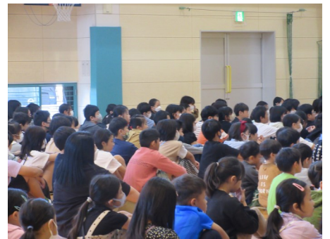
真剣に話を聴く子どもの姿