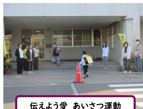
伝えよう愛 あいさつ運動

クリーンデーには、多くの保護者、おやじの会、自治会の皆様にご協力を頂き、ありがとうございます。おかげさまで、大変きれいになりました。子どもたちは、きれいになった運動場で、運動会本番におけ、練習に取り組んでいます。今年は、ブロック対抗リレー、子どもたちが考えた全校競技も実施します。ぜひお楽しみください。毎日の練習は、とても疲れると思います。「早寝・早起き・朝ご飯」をよろしくお願いいたします。