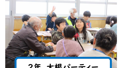
2年 大根パーティー