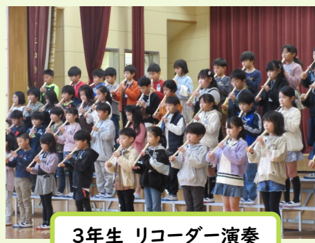
3年生 リコーダー演奏