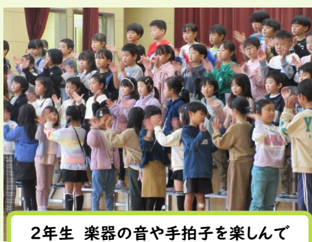
2年生 楽器の音や手拍子を楽しんで