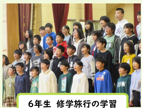
6年生 修学旅行の学習

12月9日、多くの皆様にご参集いただき、音楽発表会を開催することができました。それぞれの学年が学習した内容を歌にのせて表現しました。子どもたちは、聴いてくださる方に、感動を届けるため一生懸命に練習してきました。発表会当日は、これまでで最高の歌をお聞かせすることができたと満足していました。