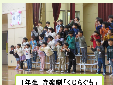
1年生 音楽劇「くじらぐも」