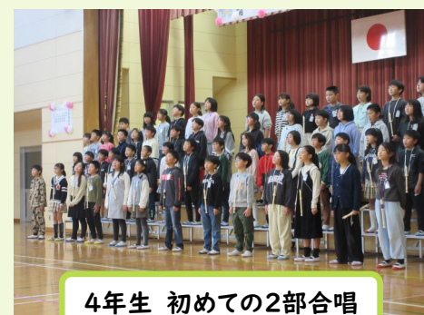
4年生 初めての2部合唱